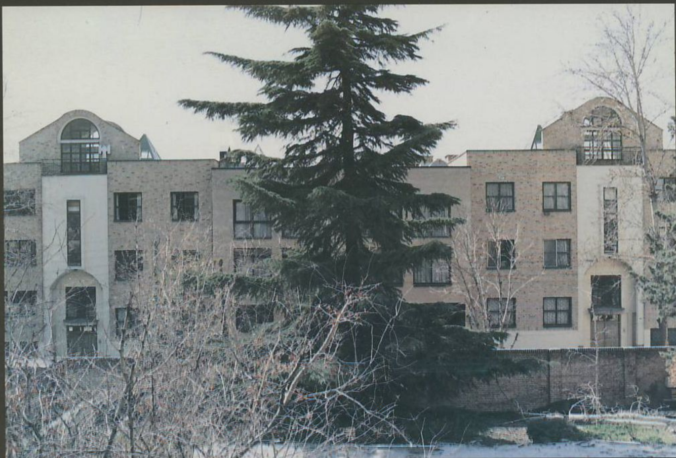
خانه پیرایش. کار فریار جواهریان