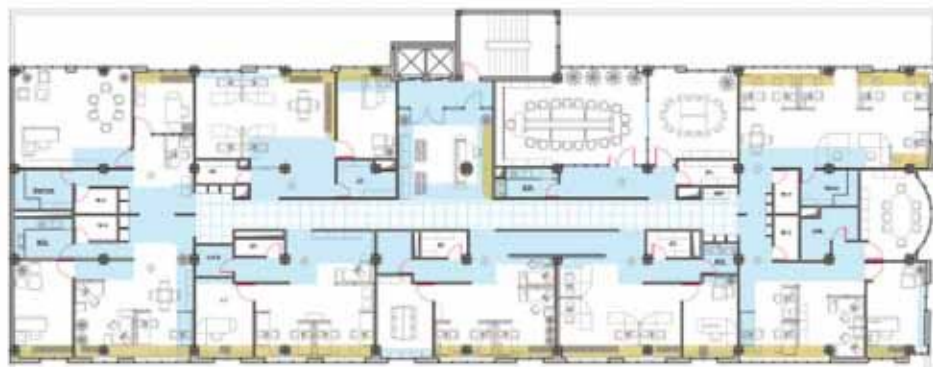
First floor plan, after renovation