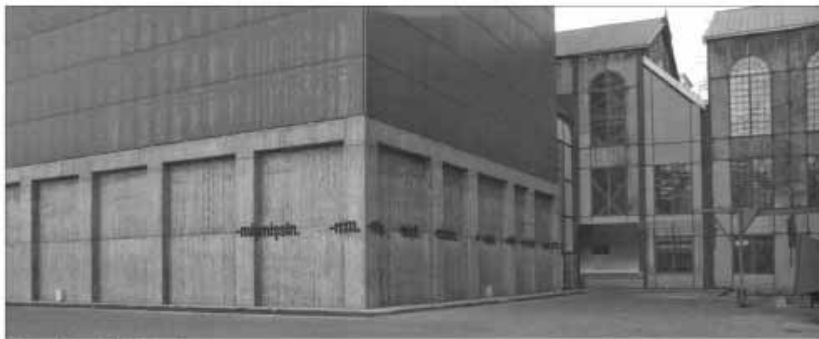
Santral Istanbul University